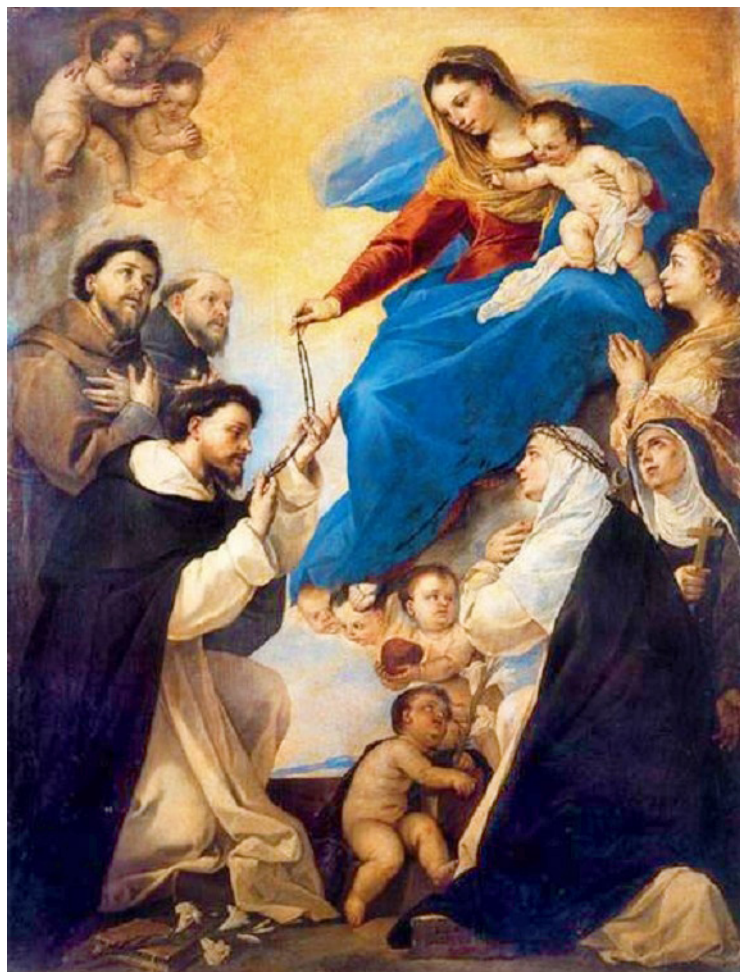
Молитва святого Розария